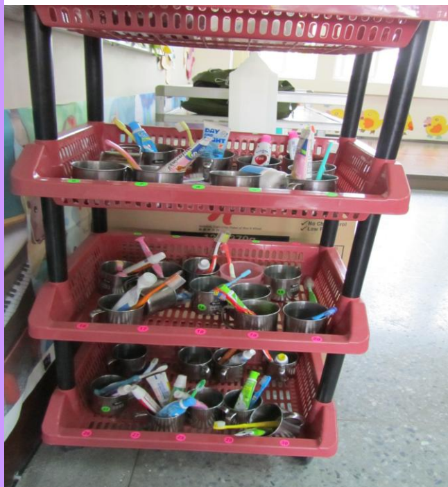
班級牙刷用具擺放整齊